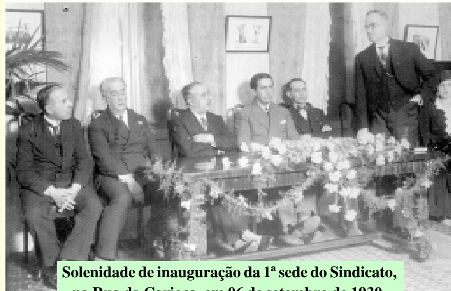
Solenidade de inauguração da 1ª sede do Sindicato, na Rua da Carioca, em 06 de setembro de 1930.

na Santa Casa de maneira filantrópica, freqüentavam os salões da Academia Nacional de Medicina e atuavam, esporadicamente, na medicina preventiva. Nem todos os médicos no Brasil eram assim. Muitos deles, entretanto, acompanhavam este perfil profissional. Outros procuravam atingi-lo.